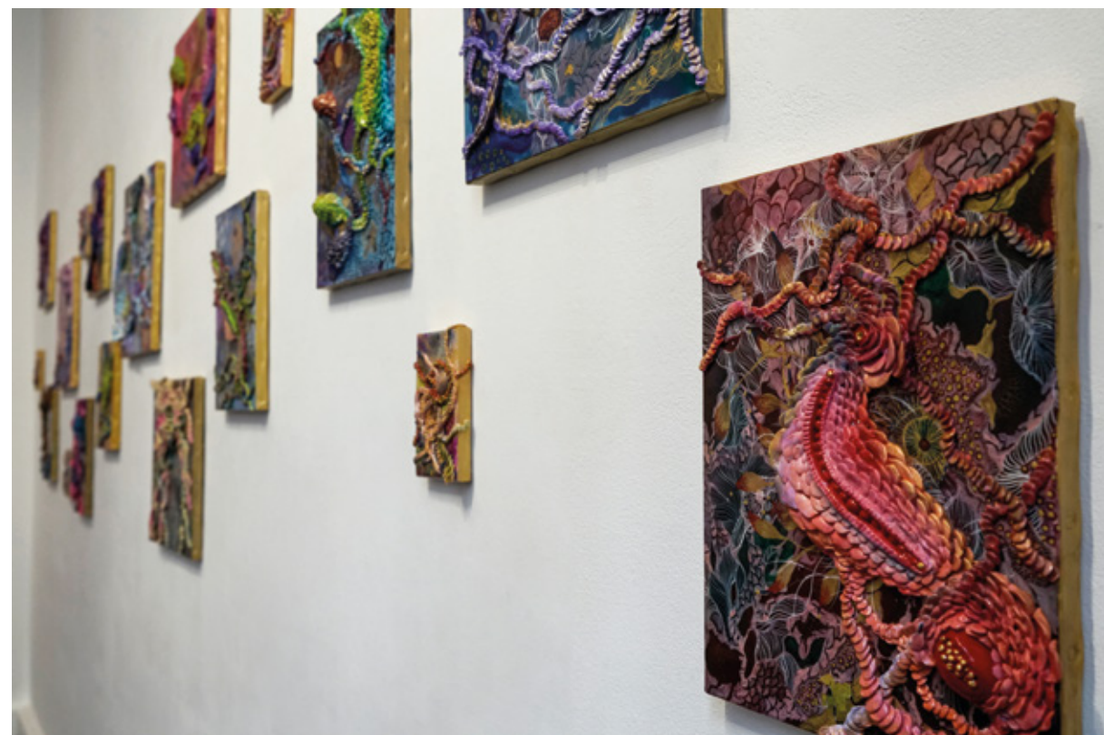
OKAYOKO / @okayoko14