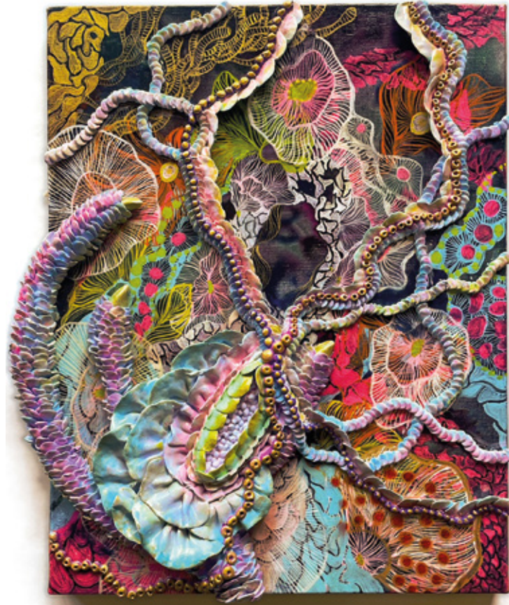
Z ▲ Technique mixte - Peinture acrylique, pâte à papier 40,9x31,8 cm 2023