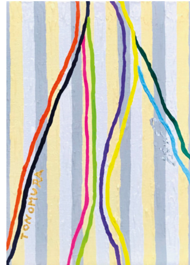
君の志 ◀ アクリルガッシュ 31,8x41 cm 2024