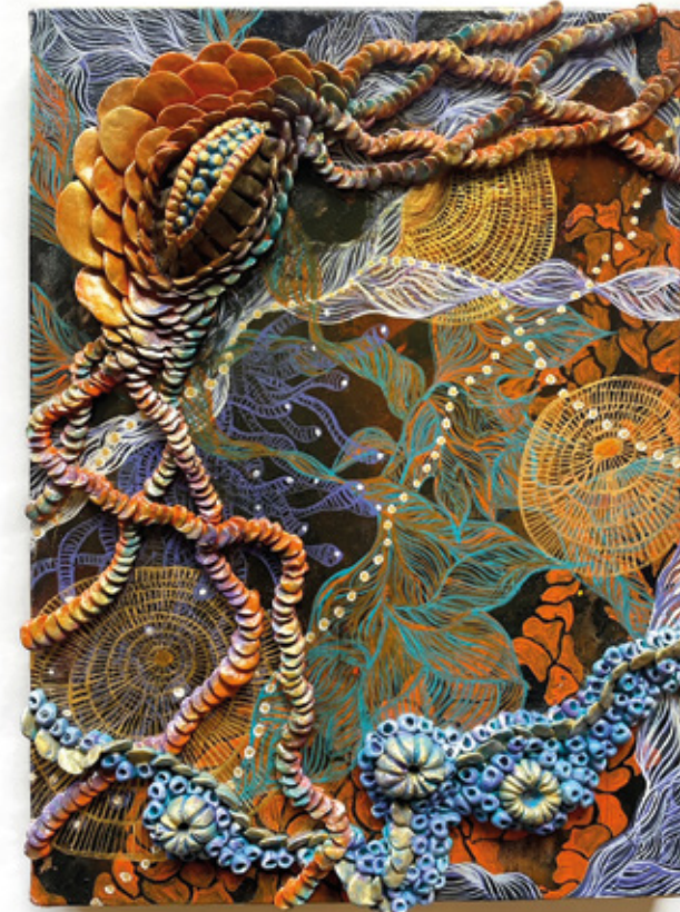
Z ◀ 混合技法 - アクリル絵の具・紙粘土 40,9x31,8 cm 2023