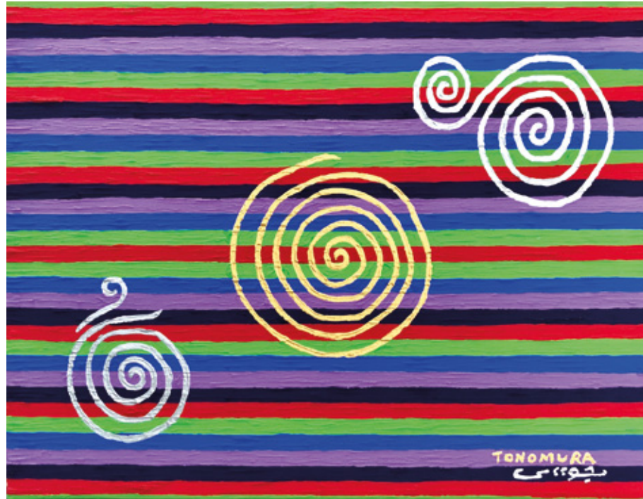
Votre ambition ▲ Gouache 31,8x41 cm 2024