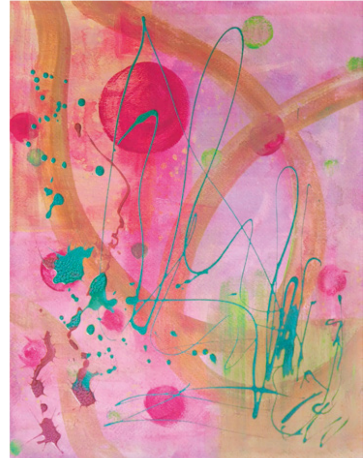
Esprit de la forêt ► Technique mixte 45,5 x 38 cm 2024