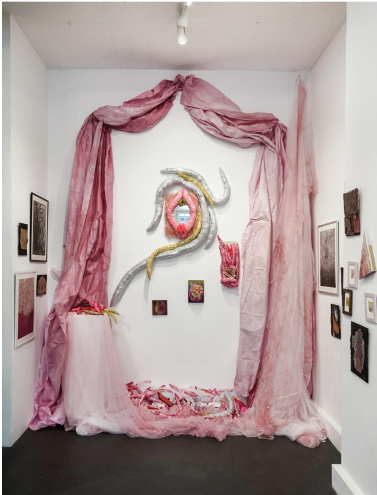
HIROMI SATO / @zuotenghiromi78