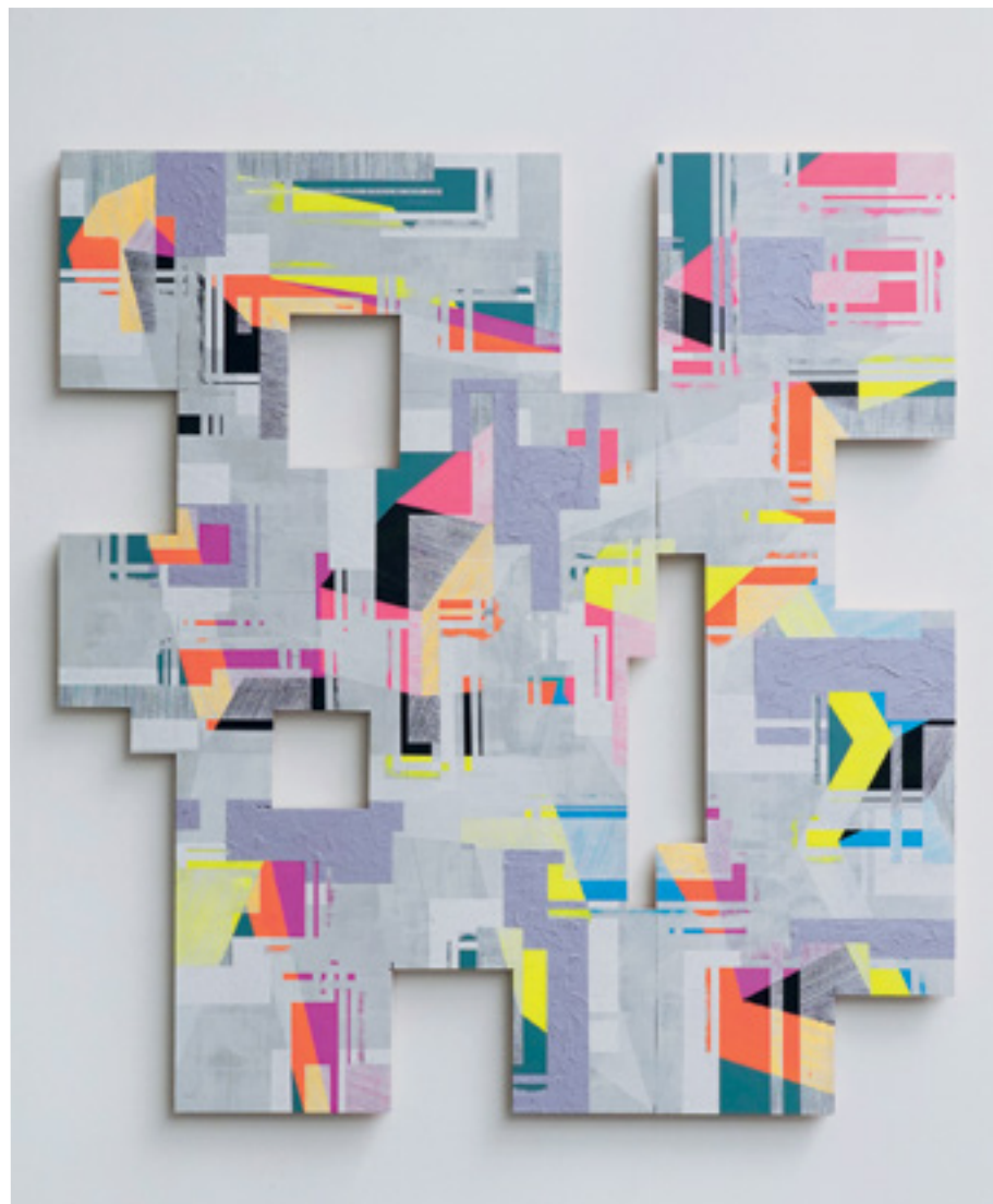
LCCH-2 Acrylique, crayon de couleur, bombe de peinture sur panneau multiplex Acrylics, coloured pencil, spray paint on multiplex board 200x190 cm 2023