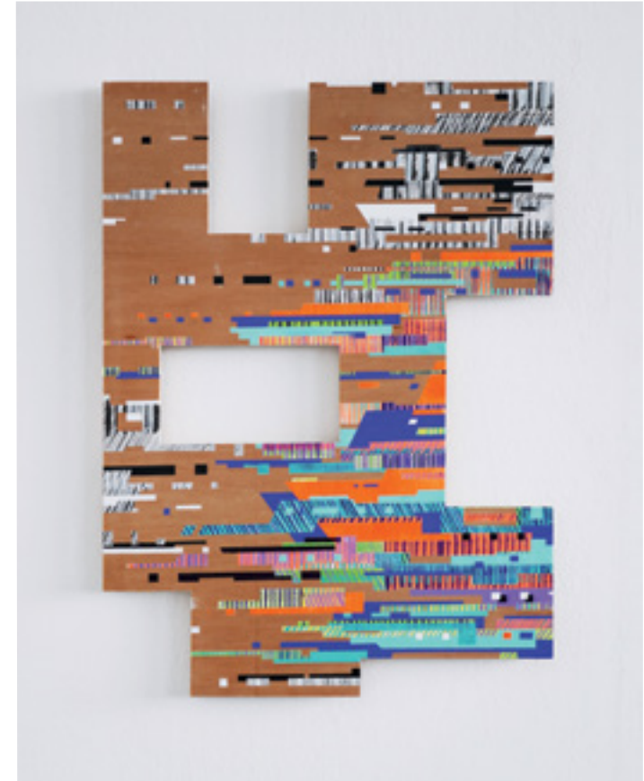
McBT_2 Acrylique sur contreplaqué / Acrylics on plywood 59,5x43,5 cm 2024