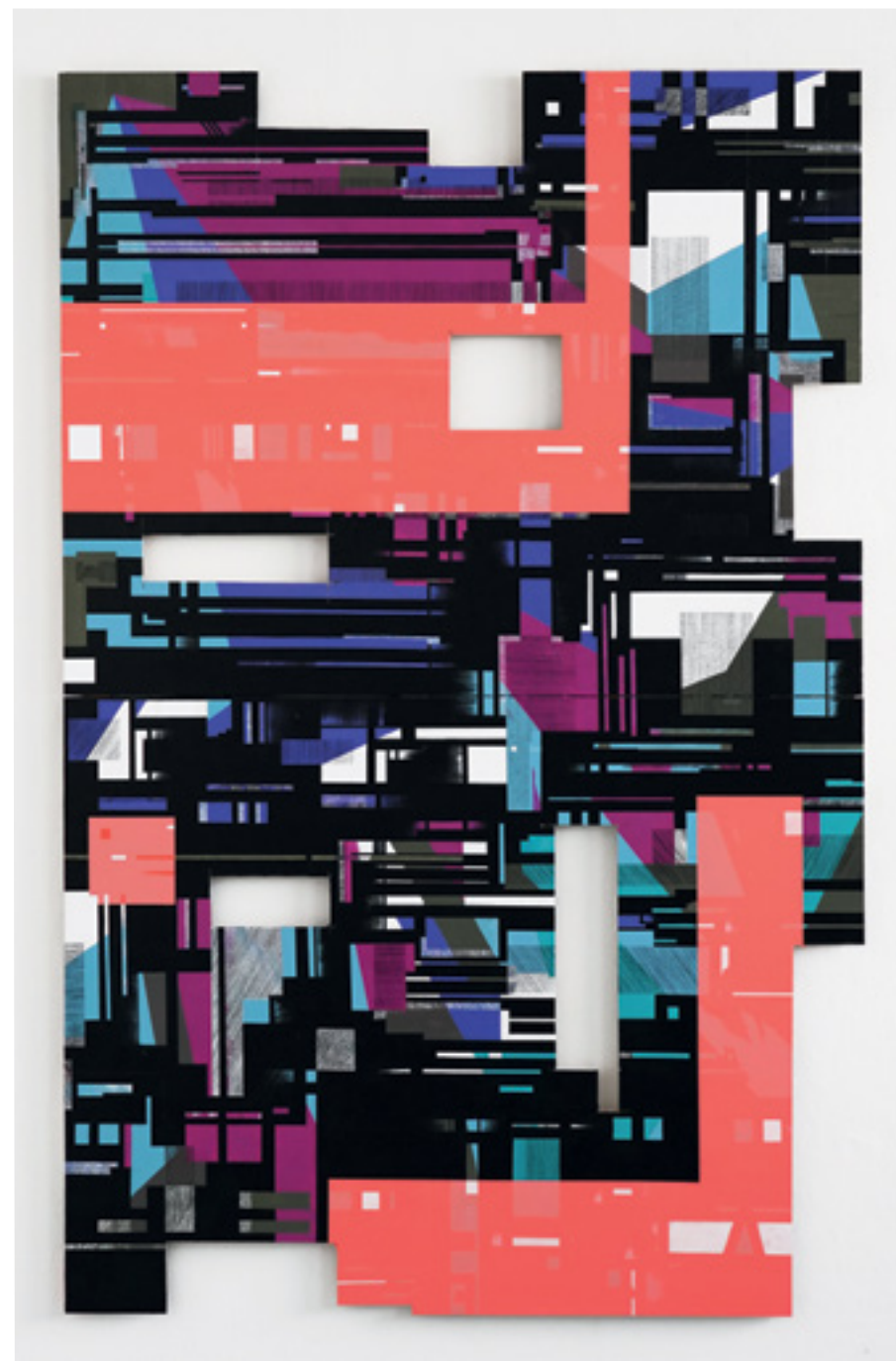
Bomy Acrylique, crayon de couleur sur panneau multiplex / Acrylics, coloured pencil on multiplex board 200x130 cm 2024