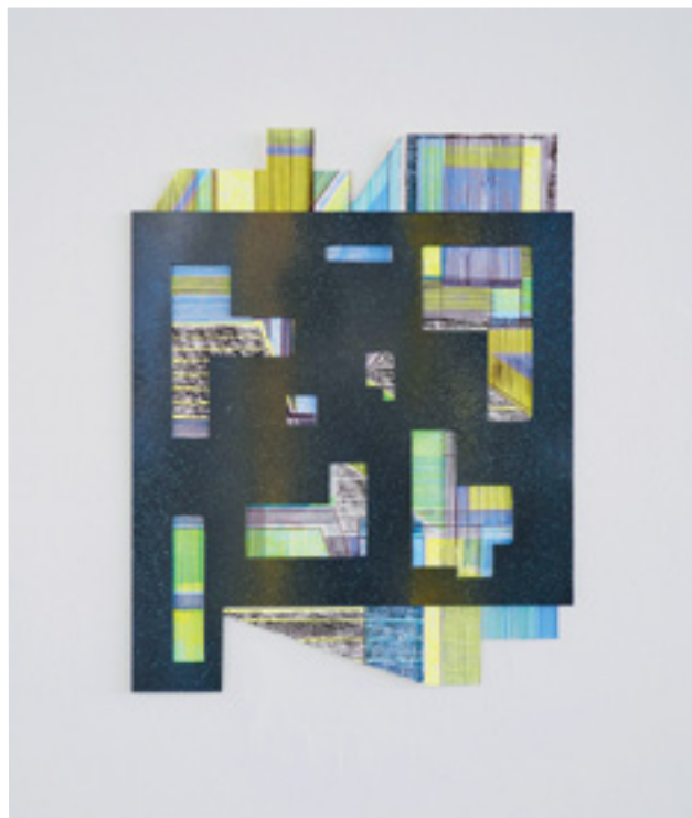
SaL/Pe_2 Acrylique, crayon de couleur, bombe de peinture sur papier à la cuve et carton Acrylics, coloured pencil, spray paint on handmade paper and cardboard 50x40 cm 2024