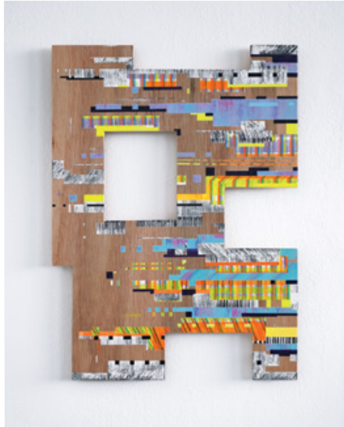
McBT_1 Acrylique sur contreplaqué / Acrylics on plywood 59,5x43,5 cm 2024