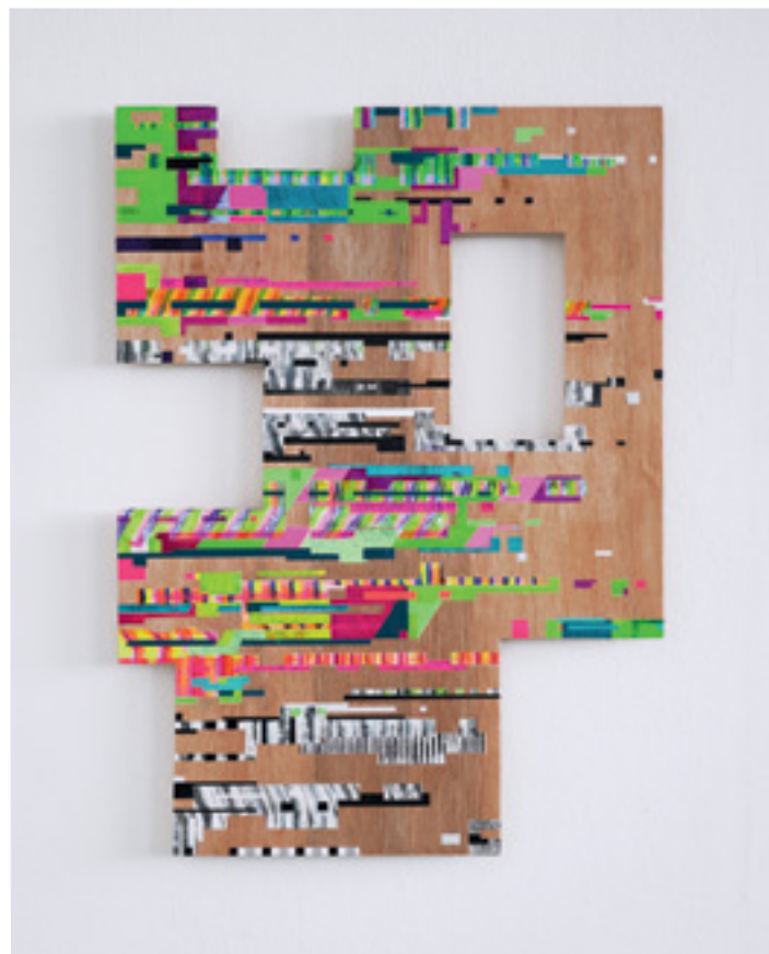
McBT_3 Acrylique sur contreplaqué / Acrylics on plywood 59,5x43,5 cm 2024