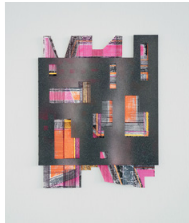
SaL/Pe_3 Acrylique, crayon de couleur, bombe de peinture sur papier à la cuve et carton Acrylics, coloured pencil, spray paint on handmade paper and cardboard 50x40 cm 2024