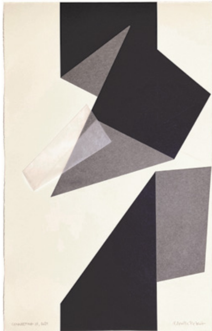
Connecting 01 Gravure 50 x 90 cm 2023