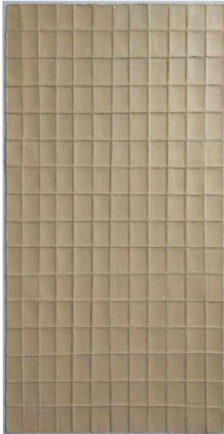
Sans Titre / Untitled Papier à gravure allemand plié et peint à l'acrylique 41,91 x 22,86 cm 1979