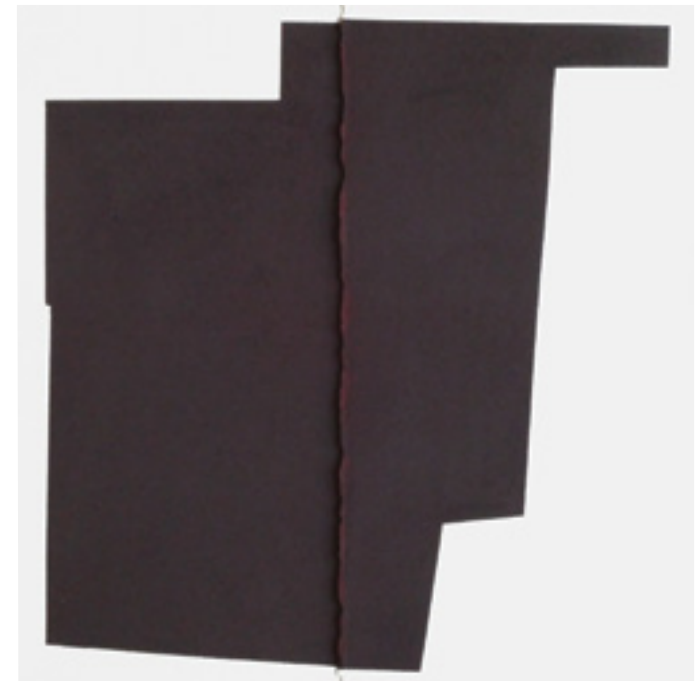
Pli-poudre Pastel sur papier Arches 300g 30 x 30 cm 2024