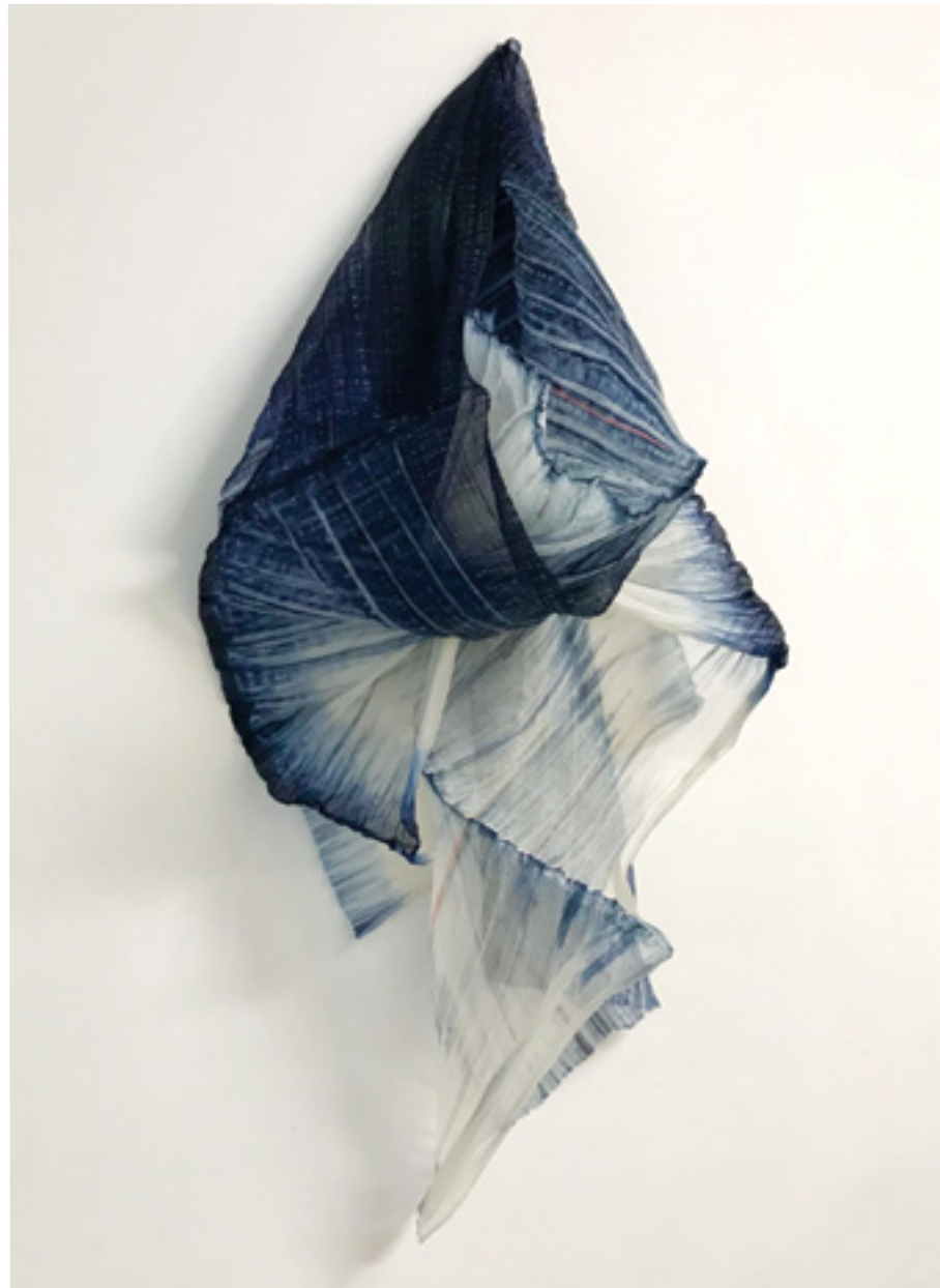
Chrysalide Plissée et teinture shibori sur organza de soie 120x60x35 cm 2023