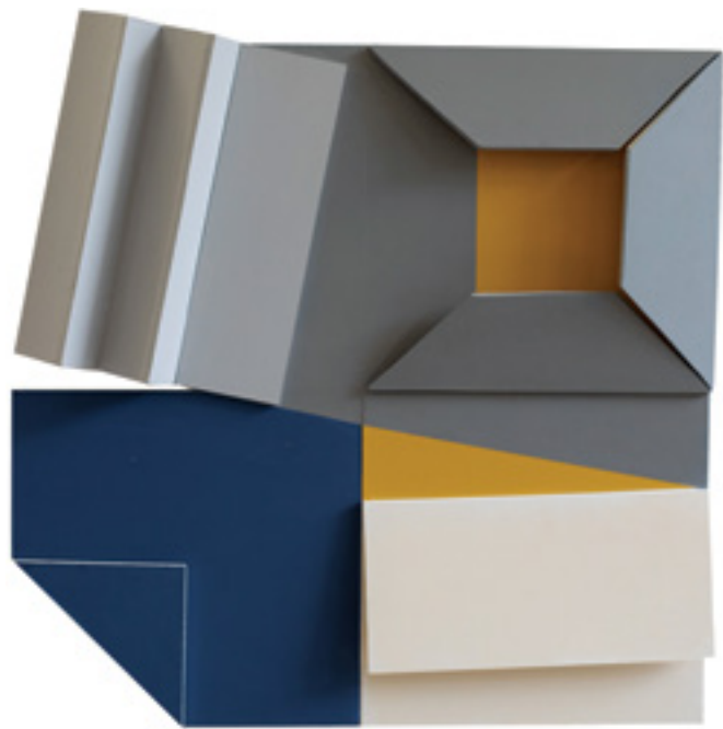
Plié en quatre Acrylique sur PVC 40 x 40 cm 2024