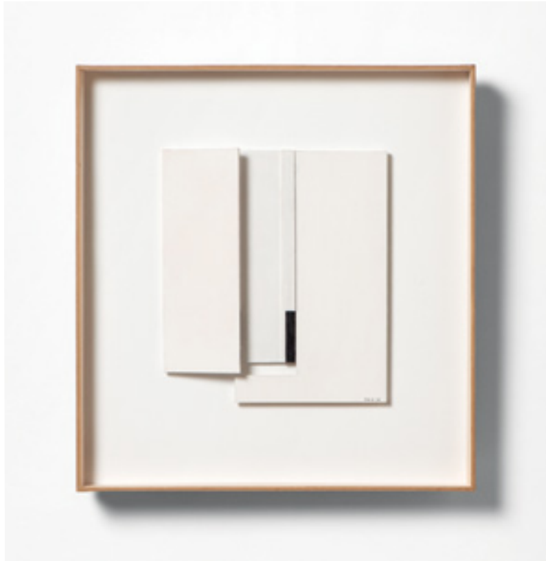
Amost Square Assemblage carton et bois peint 32x30 cm 2023