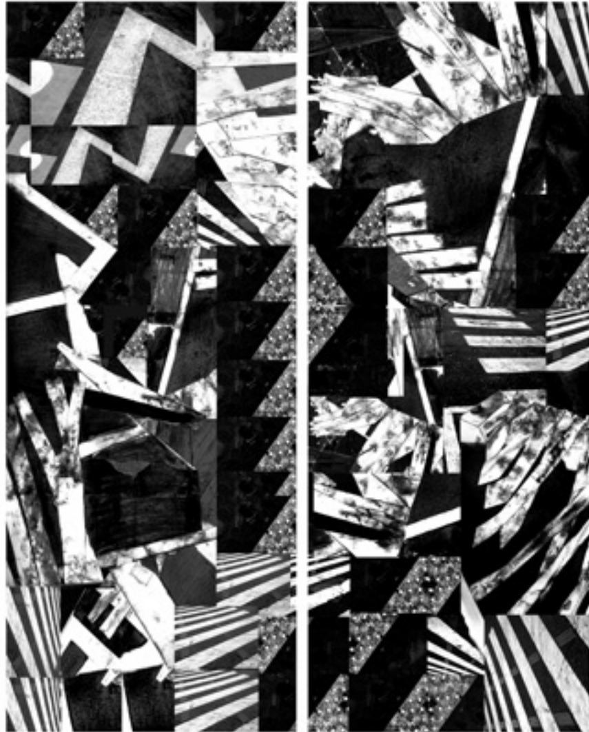
Street Flight Collage numérique 70 x 60 cm 2013