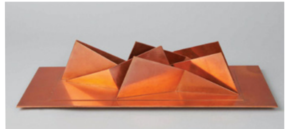
Cuivre 7 éléments Cuivre 47 x 20 x 10 cm 1999