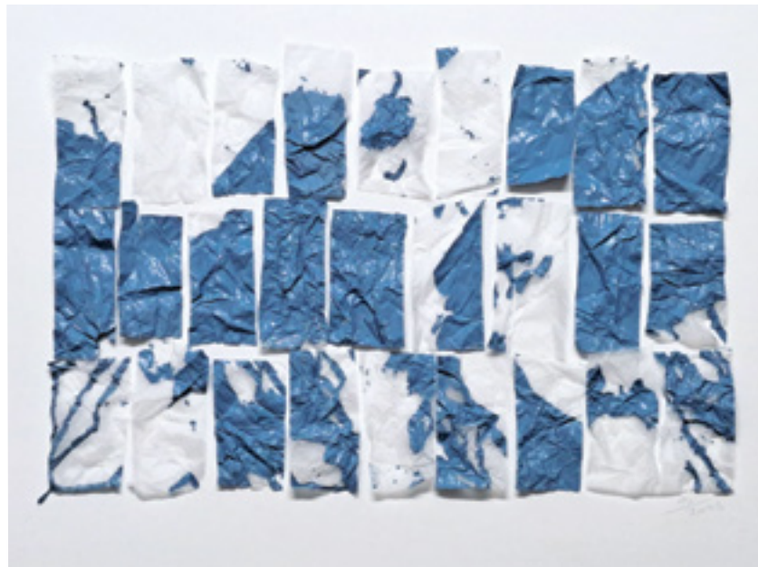
Froissé bleu et blanc Acrylique sur papier de soie posé sur carte 35 x 50 cm 2023