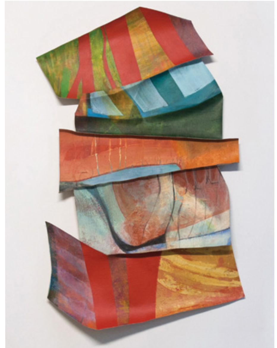
sbc 237x Collage de fragments de peinture acrylique sur toile de lin 78 x 56 cm 2023