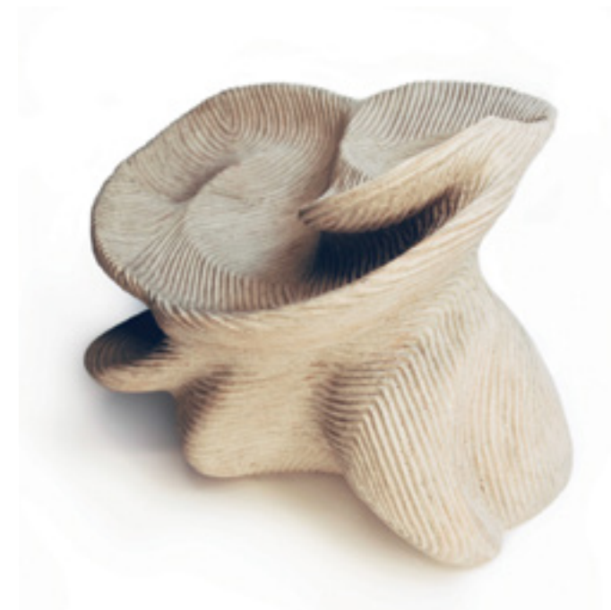
Vasques Céramique, grès émaillé 23x34x25 cm 2024