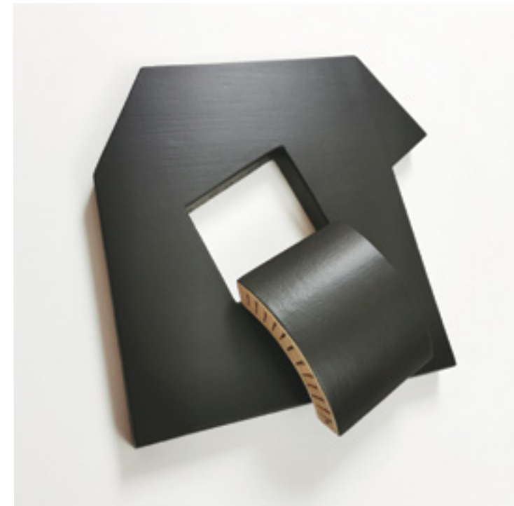
Black Book Acrylique sur bois, avec charnière 33 x 30 x 6 cm 2024