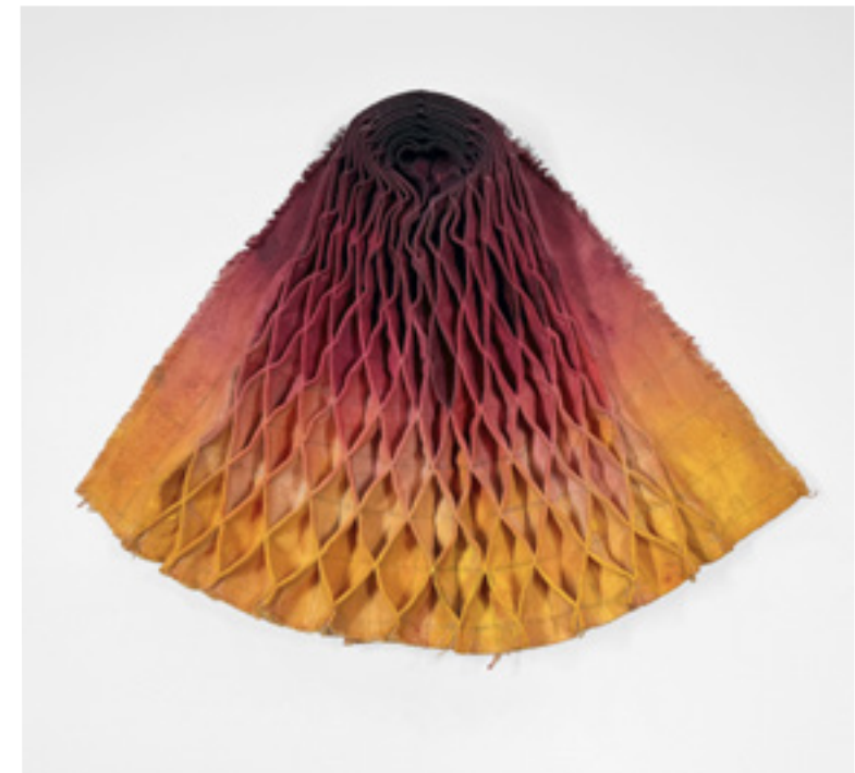
Untitled Peinture acrylique, fil de coton sur smockage à la main 27 x 38 x 6 cm 2023