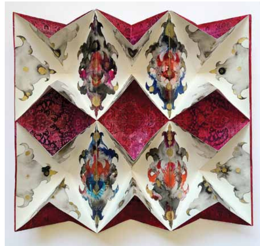
Memory Reflecting Patterns ▲ Techniques mixtes sur papier 40 x 50 x 8 cm 2023