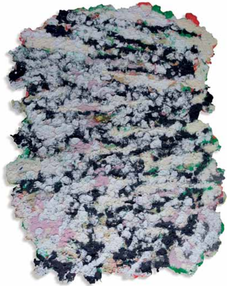
Sans titre ▲ Papier mâché recyclé 78 x 60 cm 2023