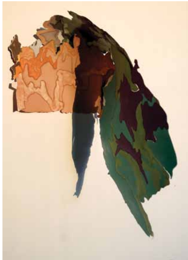
Fragments ▲ Feutre sur papier découpé assemblé 24 x 20 cm 2023