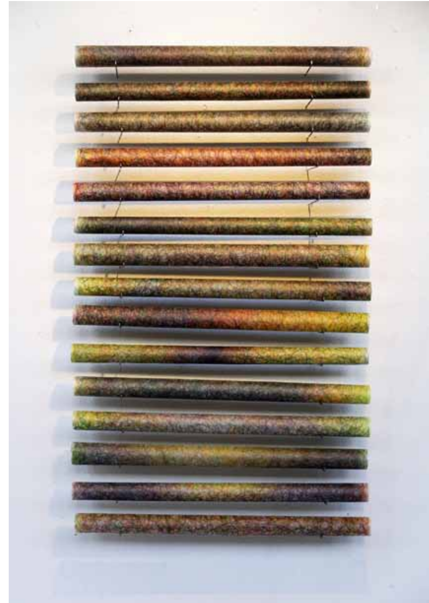
Sans titre ▲ Installation dessins feutre et calque Dimension variable 2022