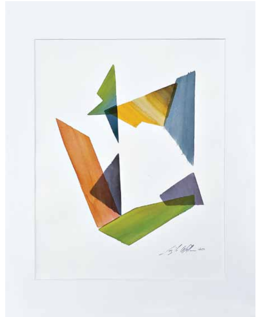
Suspendu ▲ Encre sur papier aquarelle 50 x 40 cm 2022