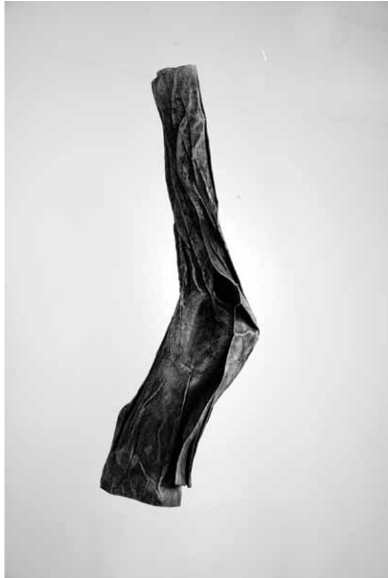
Sans titre ▲ Papier plissé au fusain 40 x 11 x 9 cm 2023

© Abstract Project 5, rue des Immeubles-Industriels 75011 Paris contact@abstract-project.com Édition Abstract Project Création Denise Demaret-Pranville