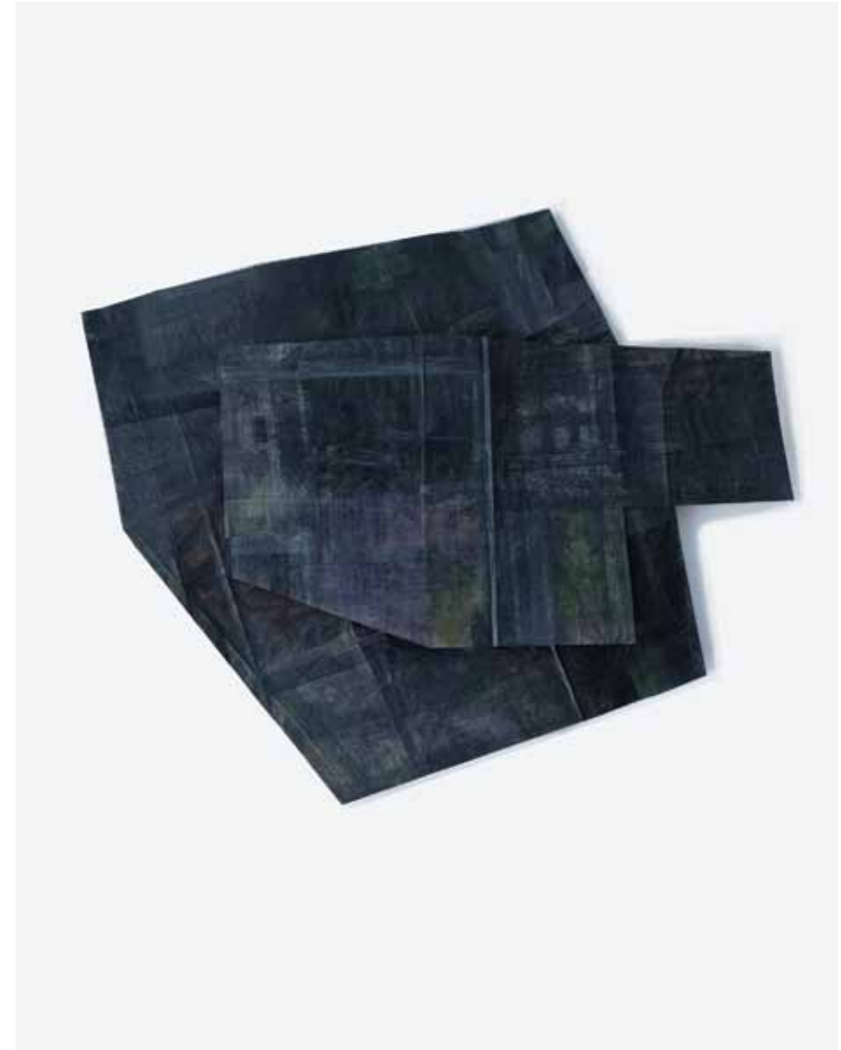
Vestiges 52_53 ▲ Technique mixte sur papier 61x71 cm 2023