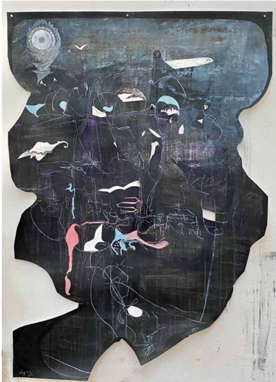
Voyage ▲ Encre émail tempera acrylique et pastel sur papier 140x100 cm 2023