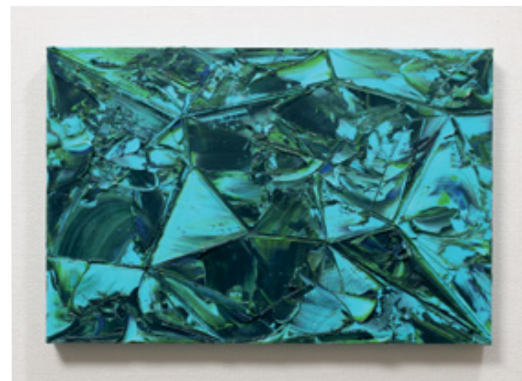
Comme une aquamarine Huile sur toile 24,2x33,3 cm 2022