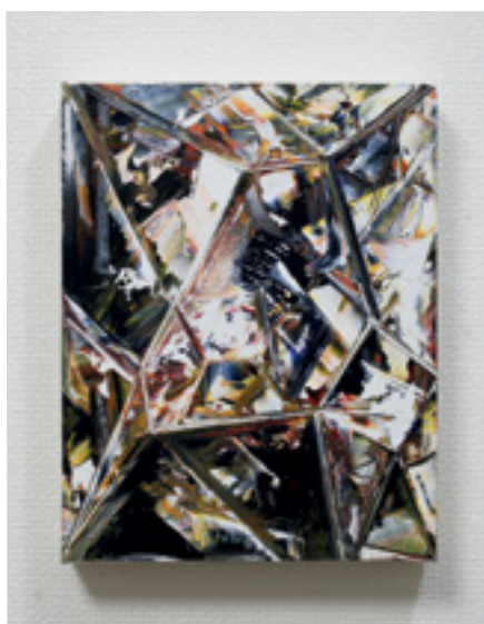
Comme un diamant Huile sur toile 18 x 14 cm 2022