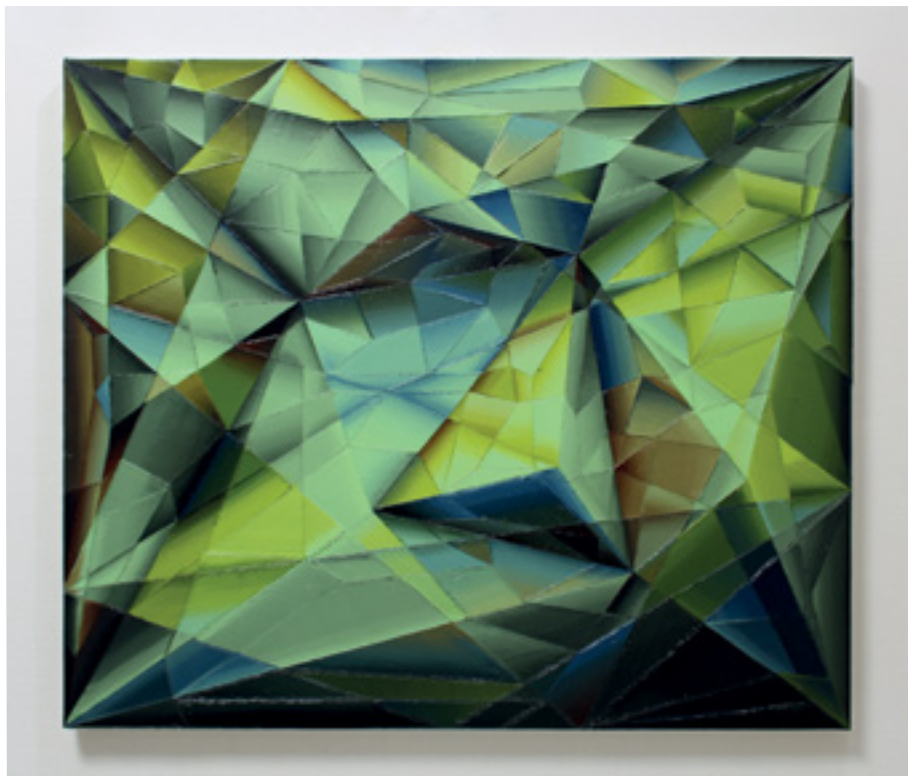
Comme une émeraude Huile sur toile 60,6x72,7 cm 2023

© Abstract Project 5, rue des Immeubles-Industriels 75011 Paris contact@abstract-project.com Édition Abstract Project Création Erdem K.Köroglu