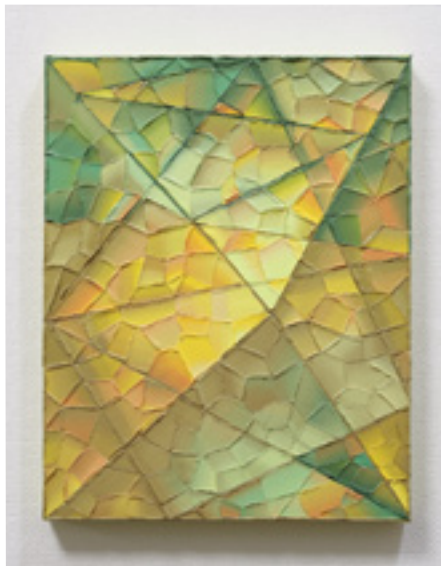
Comme une topaze Huile sur toile 27,3x22 cm 2023