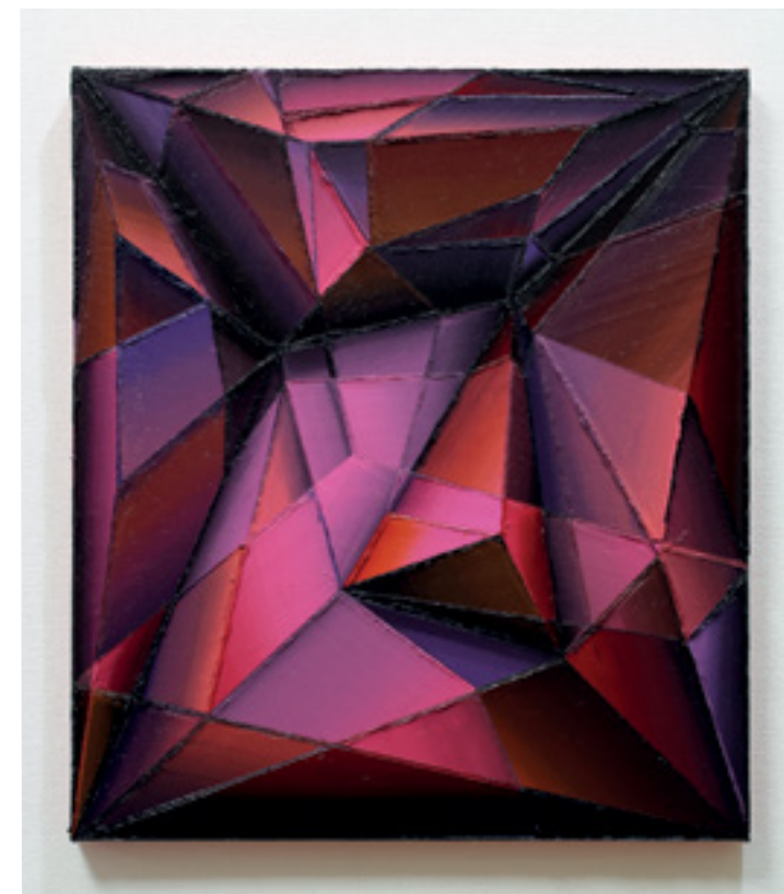
Comme un grenat Huile sur toile 45,5 x 38 cm 2023