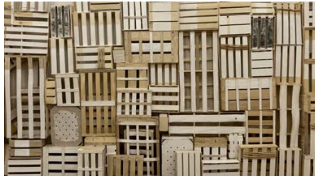
▲ Contenant(s) Installation avec cageots, élastiques, papier, acrylique, etc. Dimensions variables 2022