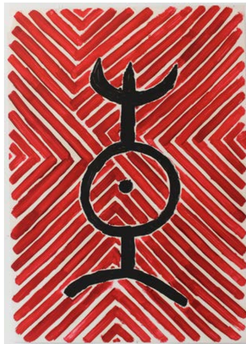
▲ Violence Huile sur papier 93x65 cm 2023