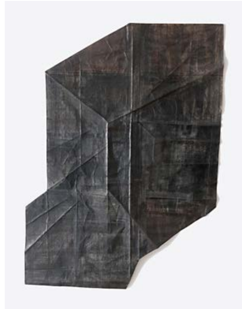
▲ # Vestige 44 Technique mixte sur papier 85x60 cm 2022