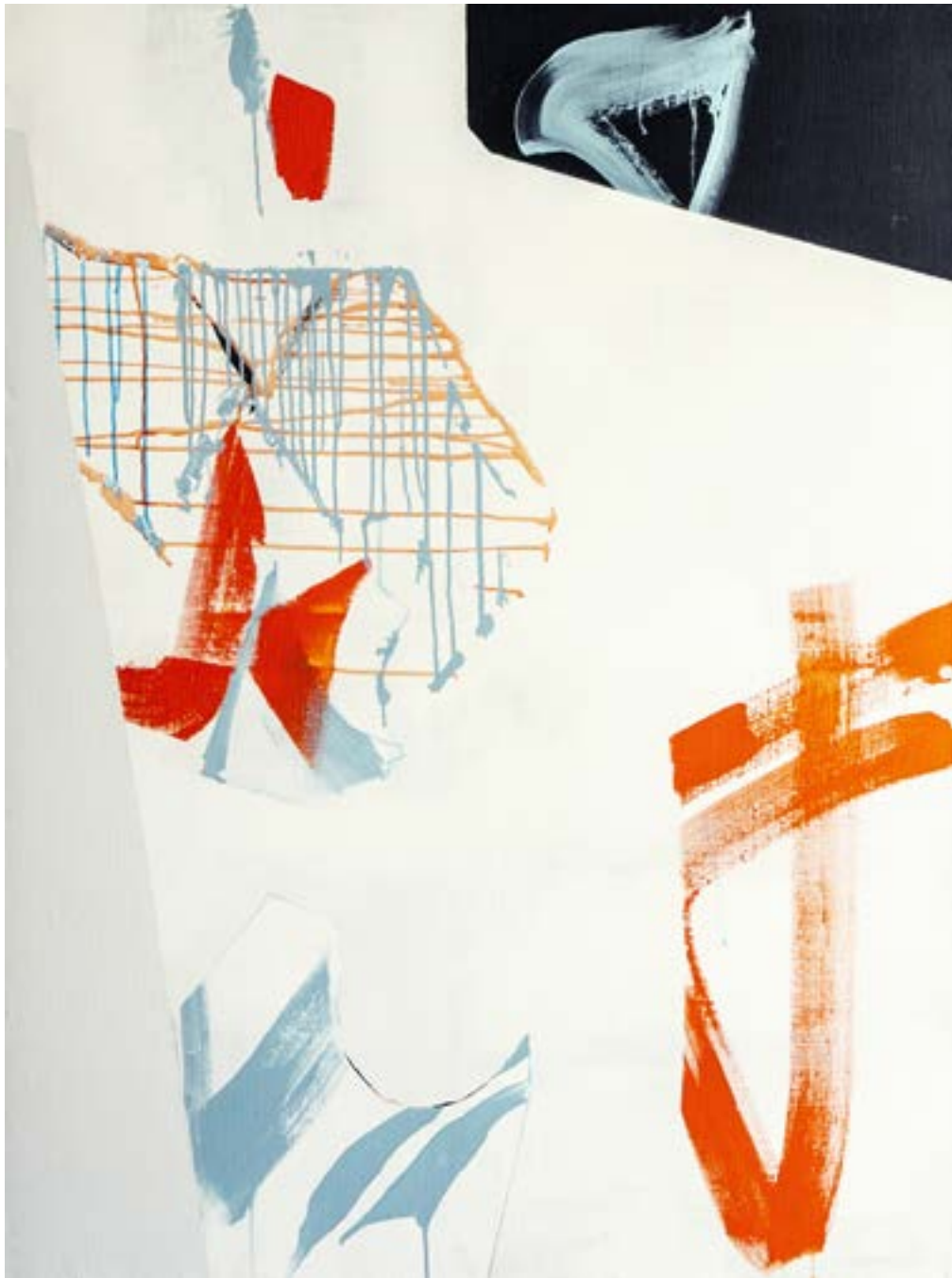
▲ Espaces dérivables #2301 Acrylique sur toile 130x97 cm 2023