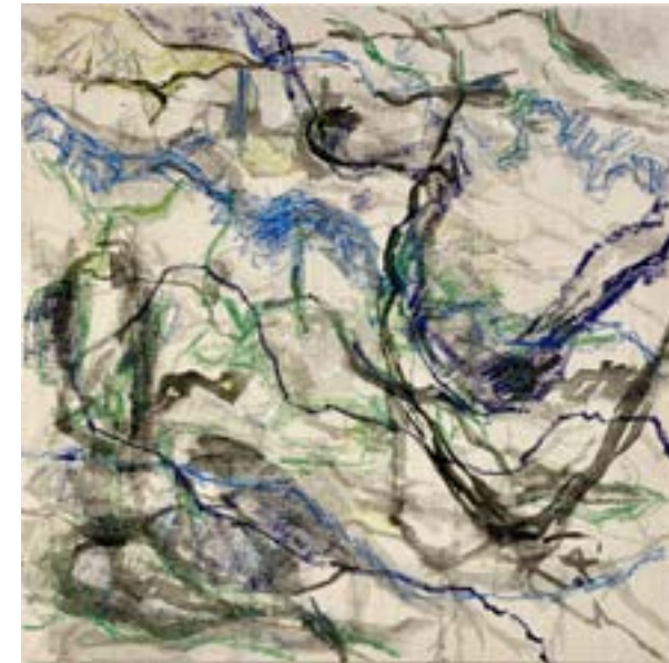
▲ Méandres Pastel à l'huile 60x60 cm 2023