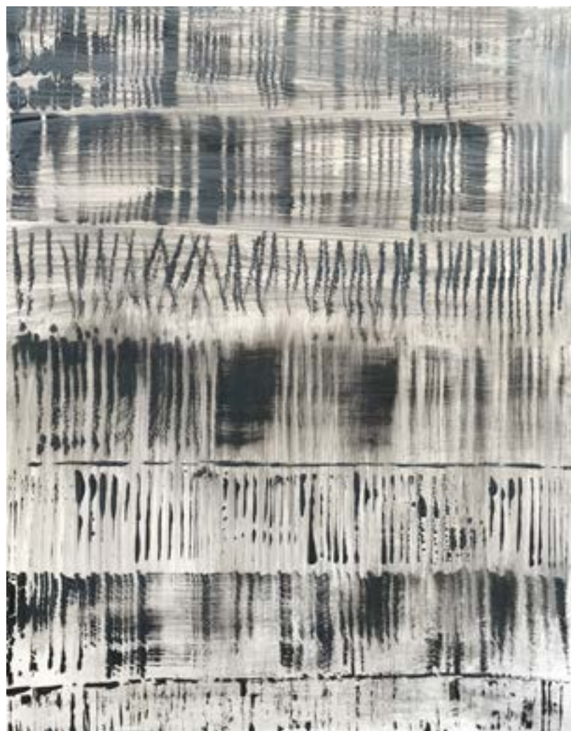
▲ Vibrations Acrylique sur papier marouflé 65x50 cm 2022