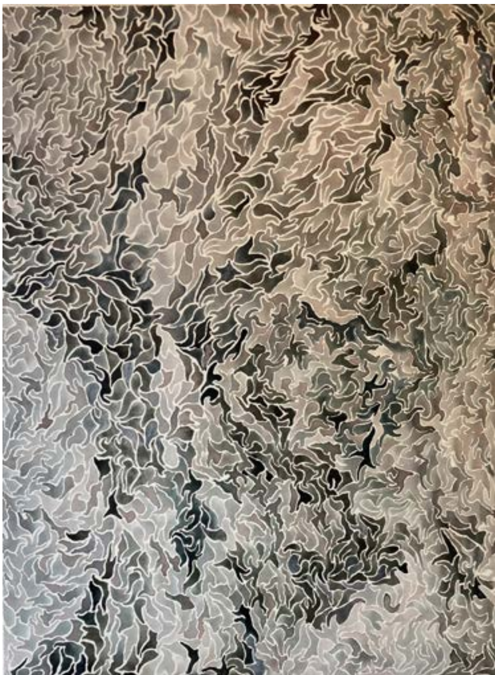
▲ Bruissement Encre sur toile 130x97 cm 2023