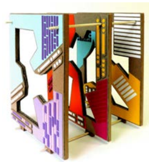
▲ Cavité colorée à trois panneaux Collage de papiers et cartons 22x26x20 cm 2023