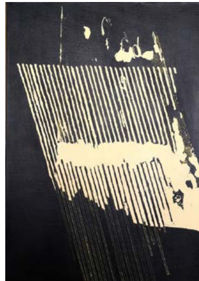
▲ SCA20 Acrylique sur toile 65x46 cm 2020