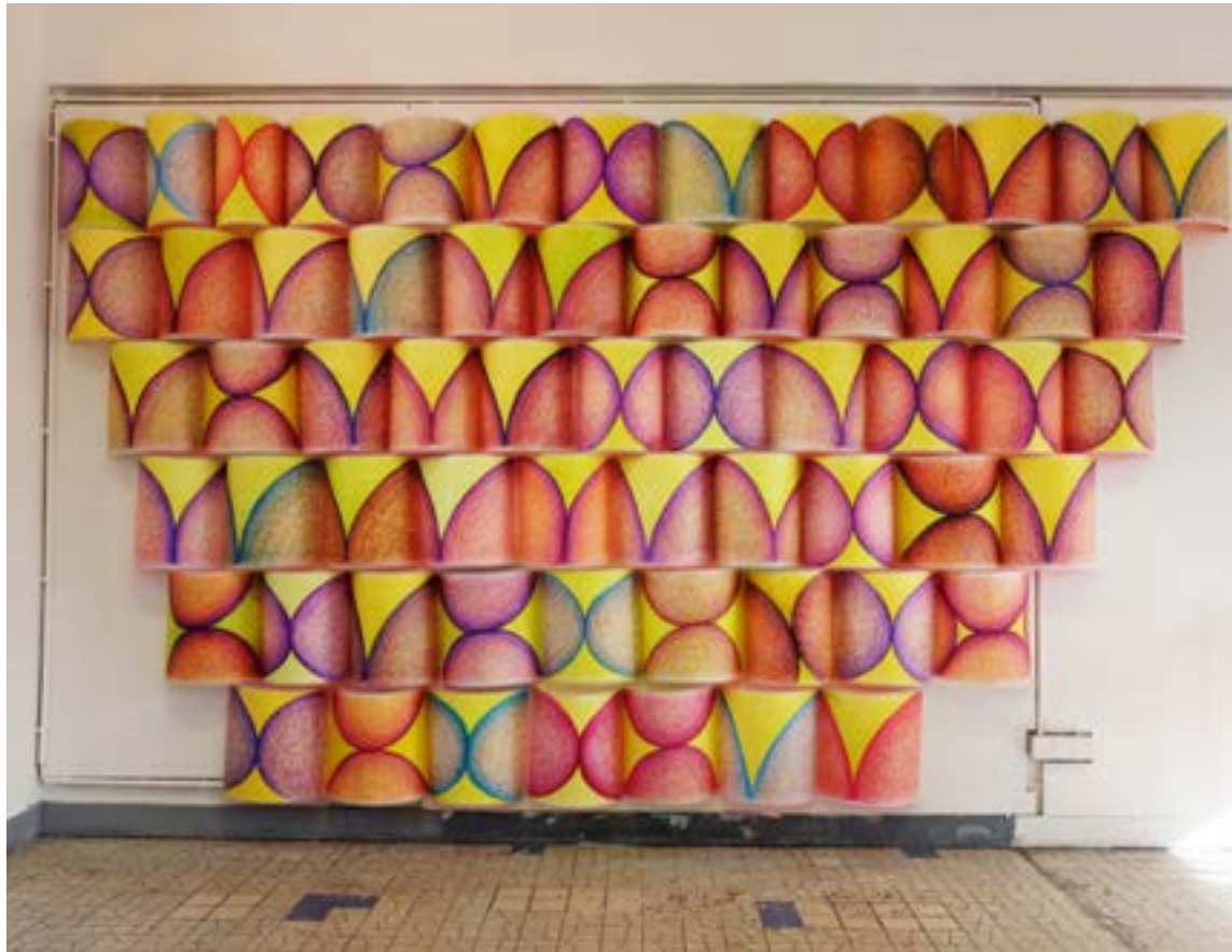
▲ Sans titre Crayon feutre sur calque 280 x 400 cm 2022