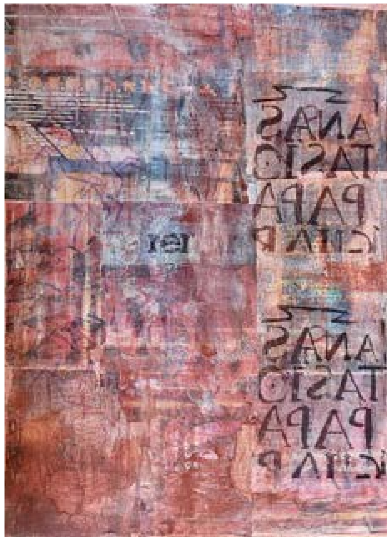
▲ La Divine Comédie Acrylique sur toile 73x54 cm 2022