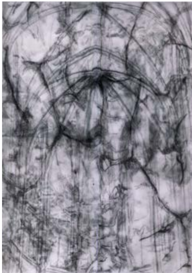
▲ Associations hallucinées Superpositions de dessins sur papier calque 45x32 cm 2021