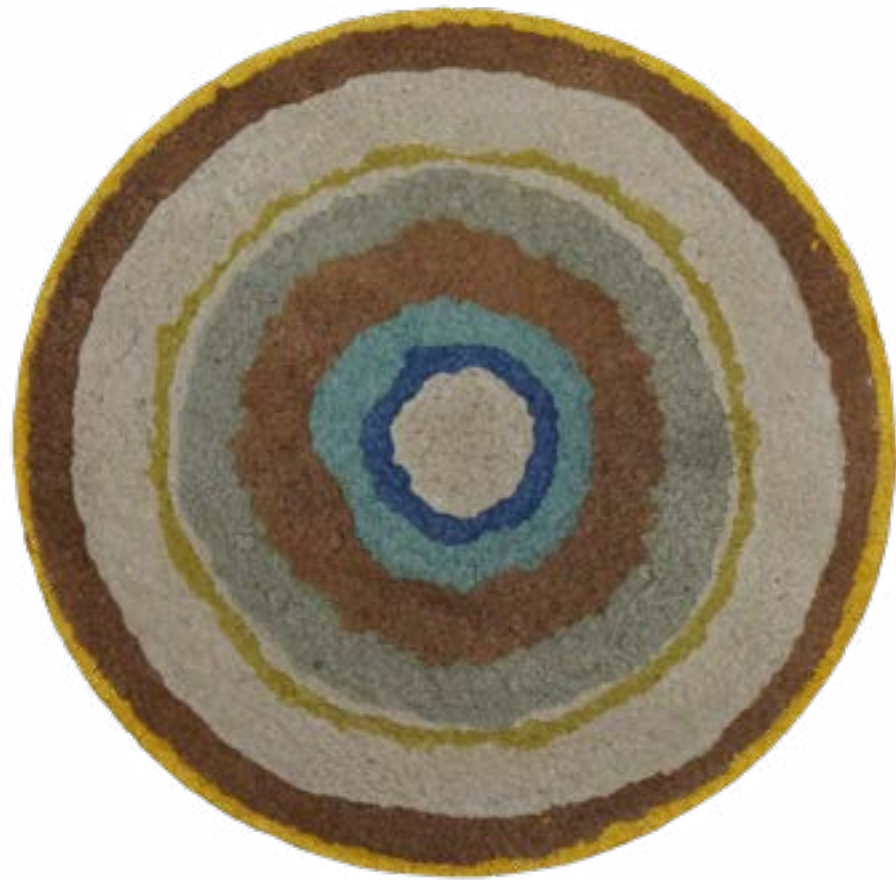
▲ Objetivo #2 Papier mâché, boîtes d'œufs recyclés Ø55 cm 2022