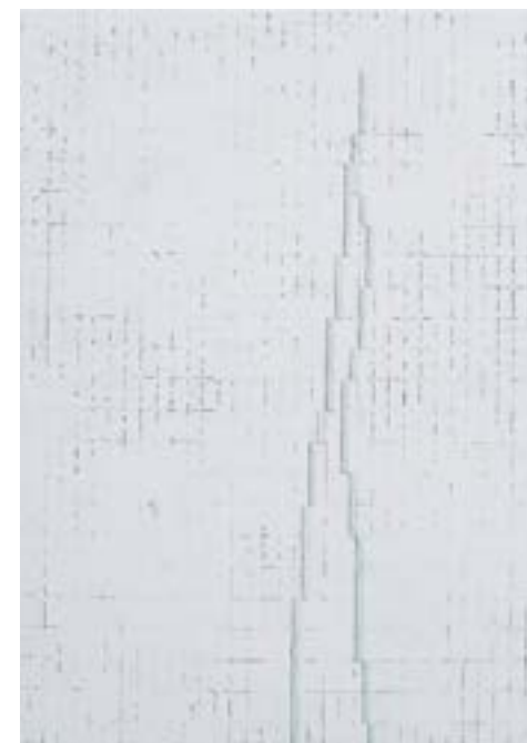
▲ Paths Grès, engobes et pigments 23x17 cm 2019