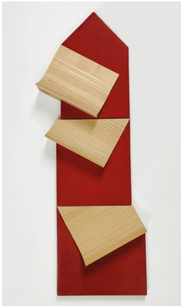
Three - part variable relief ▲ Veneer on wooden board, acrylic 65x23x4 cm 2021

Mon travail est fondé sur des principes géométriques et mathématiques. Je m'inspire des matériaux qui m'entourent dans ma vie quotidienne. Dans mes œuvres, je donne à ces matériaux un sens nouveau. Je recherche l'expression la plus simple possible, pure et sans complication.