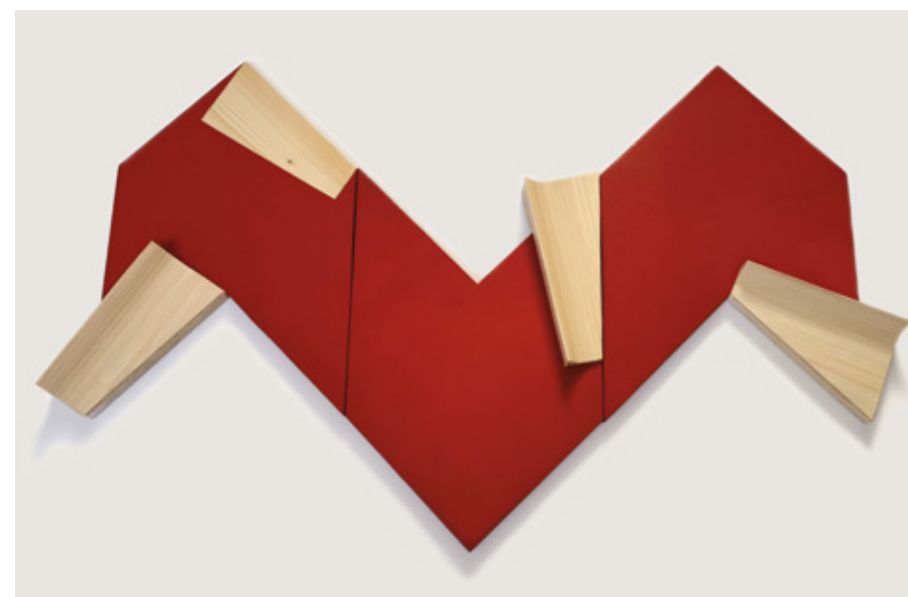
Three - part variable relief ▲ Veneer on wooden board, acrylic 60x91x4 cm 2021