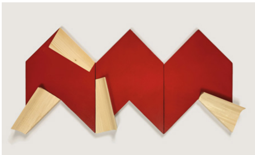
Three - part variable relief ▲ Veneer on wooden board, acrylic 42x91x4 cm 2021