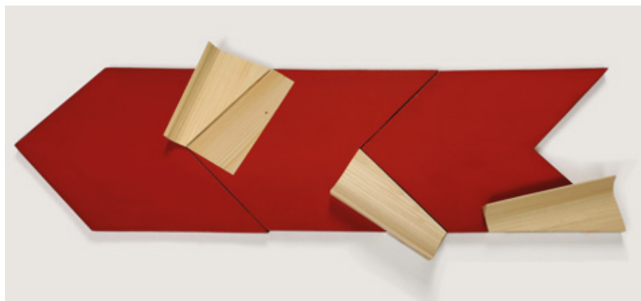
Three - part variable relief ▲ Veneer on wooden board, acrylic 36 x 100 x 4 cm 2021