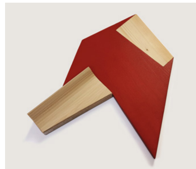
Module 210601 ▲▲ Veneer on wooden board, acrylic 42 x 36 x 4 cm 2021