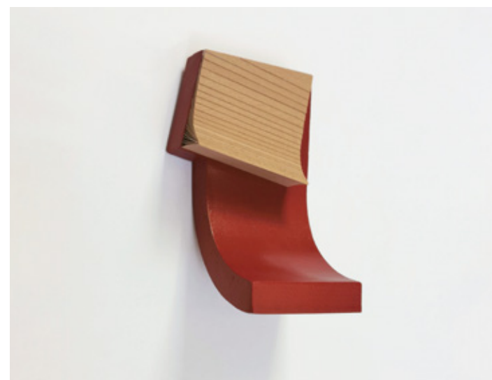
Module 210603 ▲▲ Veneer on wooden board, acrylic 20x21x4 cm 2021